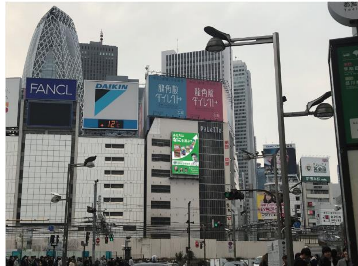
サイズ 縦 12m × 横 8m