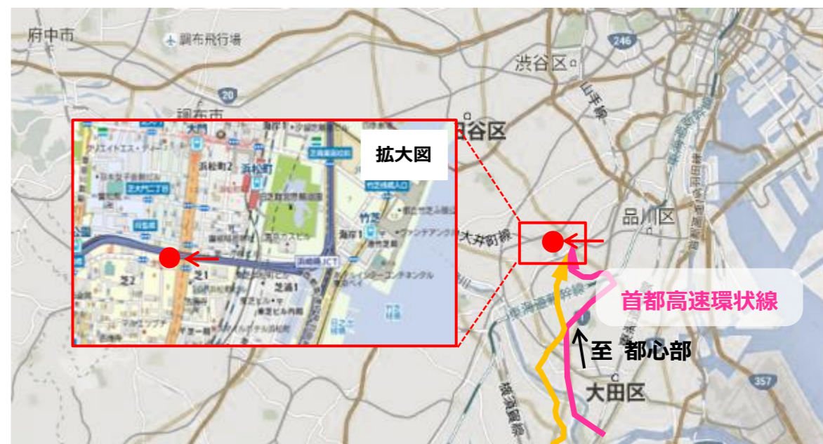
【MAP】 芝（羽田空港から東京都心へ向かう首都高速環状線）